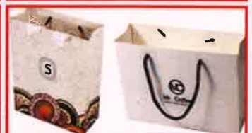
பிளாஸ்டிக் பூசப்பட்ட பைகள்