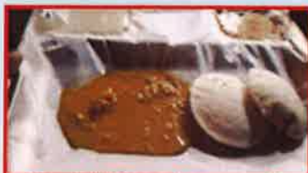
உணவுப் பொருட்களை கட்ட உபயோகப் படுத்தப்படும் பிளாஸ்டிக் தாள் உறை

தமிழக அரசு வெளியிட்டுள்ள அரசாணை எண்.84, நாள் 25.06.2018-ன் படி ஒரு முறை உபயோகப்படுத்தப்பட்டு தூக்கி எறியும் கீழ்க்கண்ட பிளாஸ்டிக் பொருட்கள் தயாரிக்கப்படுவதும், சேமித்து வைப்பதும், விநியோகிப்பதும், போக்குவரத்து செய்வதும் விற்பதும் 01.01.2019 முதல் தடை செய்யப்படுவதாக அறிவிக்கை செய்யப்பட்டுள்ளது.