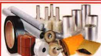
தொழில் நிறுவனங்களில் பேக்கிங்கிற்காக பயன்படுத்தப்படும் பிளாஸ்டிக்