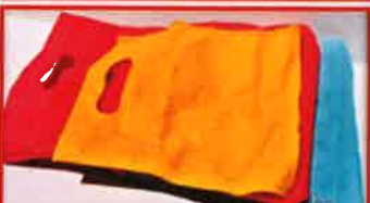
நெய்யாத பிளாஸ்டிக் தூக்கு பைகள்