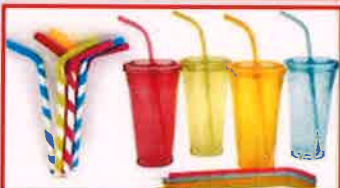
பிளாஸ்டிக் உறிஞ்சு குழாய்கள்