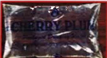
நீர் நிரப்ப பயன்படும் பைகள் / பொட்டலங்கள்