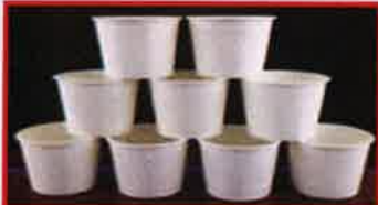
பிளாஸ்டிக் பூசப்பட்ட காசிட குவளைகள்