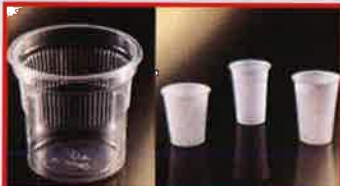
பிளாஸ்டிக் தேநீர் குவளைகள்