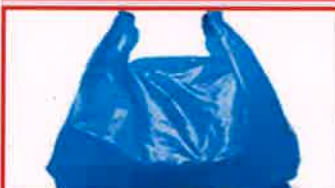
பிளாஸ்டிக் பைகள் எந்த அளவிலும் எந்த தழுமளாக இருப்பினும்