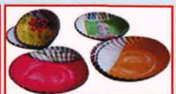
பிளாஸ்டிக் பூசப்பட்ட காசிட தட்டுகள்