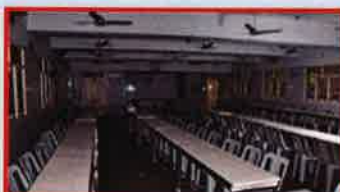
உணவு அருந்தும் மேஜையின் மீது விரிக்கப்படும் பிளாஸ்டிக் தாள்